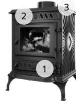
KAWMET STANDARD P3 (7.4 kW) ECO