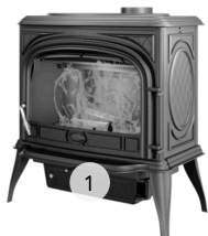
KAWMET PREMIUM NIKA S5 ECO