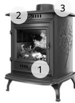
KAWMET STANDARD P10 (6.8 kW) ECO