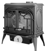
KAWMET PREMIUM ZEUS S9 ECO