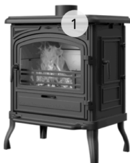
KAWMET PREMIUM EOS S13 ECO