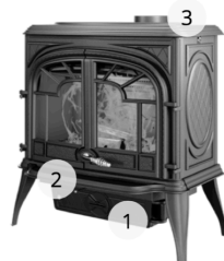
KAWMET PREMIUM SPARTA S10 ECO