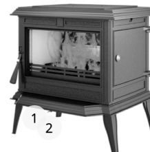
KAWMET PREMIUM ATHENA S12 ECO