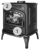
KAWMET STANDARD P7 (9.3 kW) ECO

A tüztérbetétben, elhelyezett karok segítségével történik az alábbi ábrák szerint: