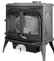
KAWMET PREMIUM ARES S7 ECO