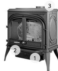
KAWMET PREMIUM HELIOS S8 ECO