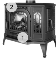
KAWMET STANDARD P7 PB (10.5 kW) ECO