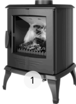
KAWMET STANDARD P8 (7.9 kW) ECO