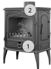
KAWMET PREMIUM SELENA S14 ECO

A kívánt fokozat a levegőszabályzó reteszek mozgatásával és a fahasábok mennyiségével illetve méretével állítható be.