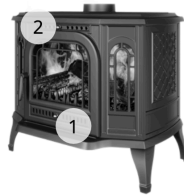
KAWMET STANDARD P7 LB (10.5 kW) ECO