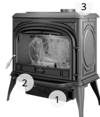
KAWMET PREMIUM SPHINX S6 ECO