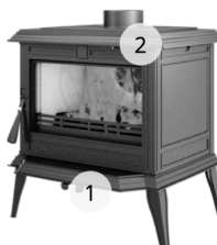
KAWMET PREMIUM PROMETEUS S11 ECO