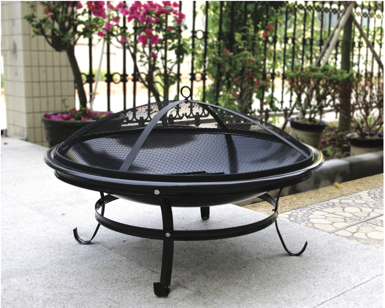
SZABADTÉRI TŰZRAKÓ-GRILLEZŐ TÁL - 76CM 21-00-600-2